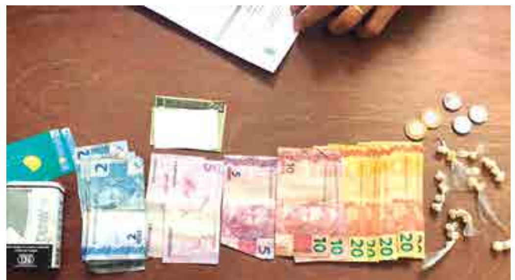
A Polícia Militar apreendeu 31 pedras de substância semelhante a crack, além de dinheiro, em abordagem