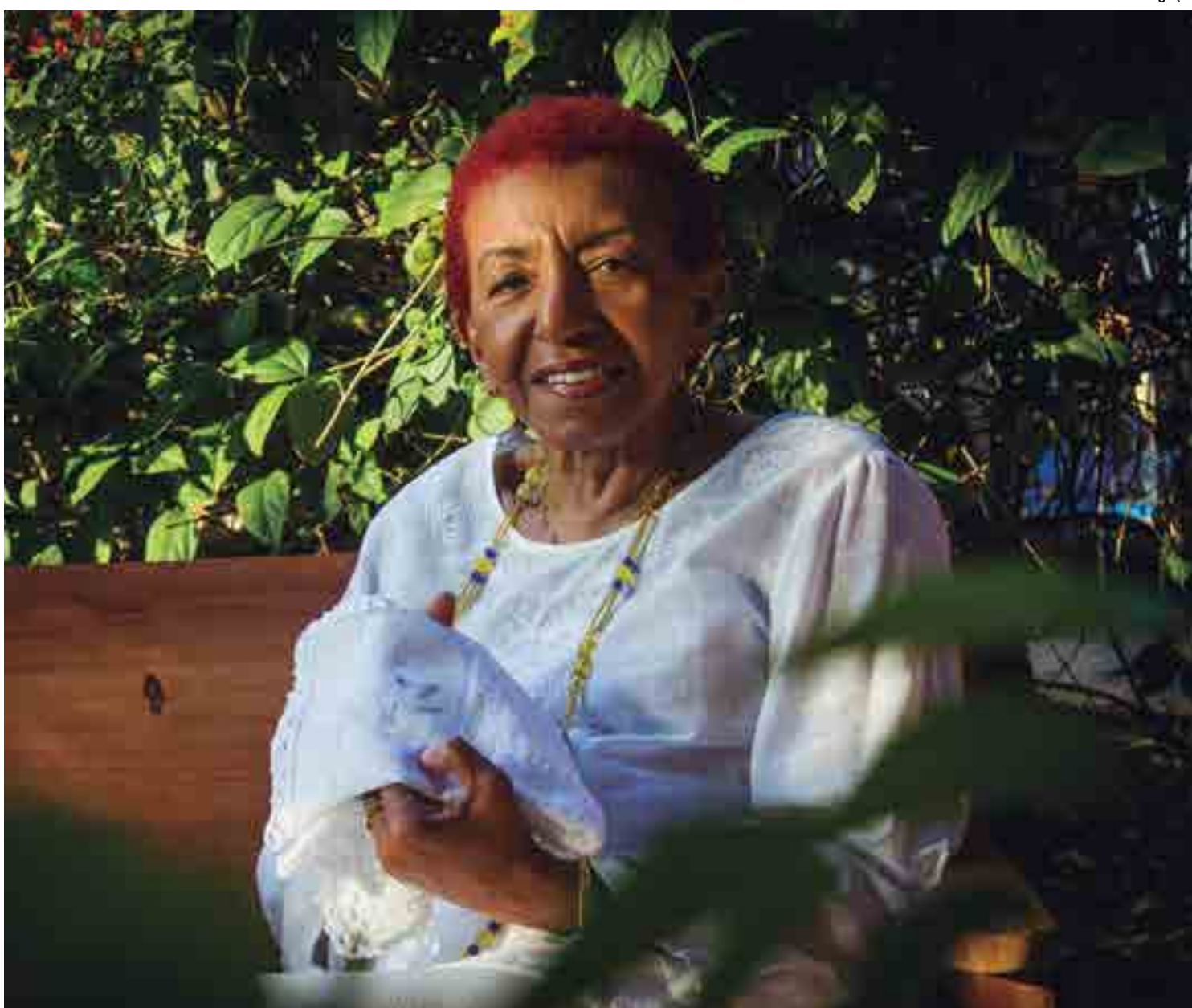
No auge dos seus 73 anos, a artista Leci Brandão demonstra ter muita disposição para fazer o que mais gosta, que é alegrar as pessoas com a sua música