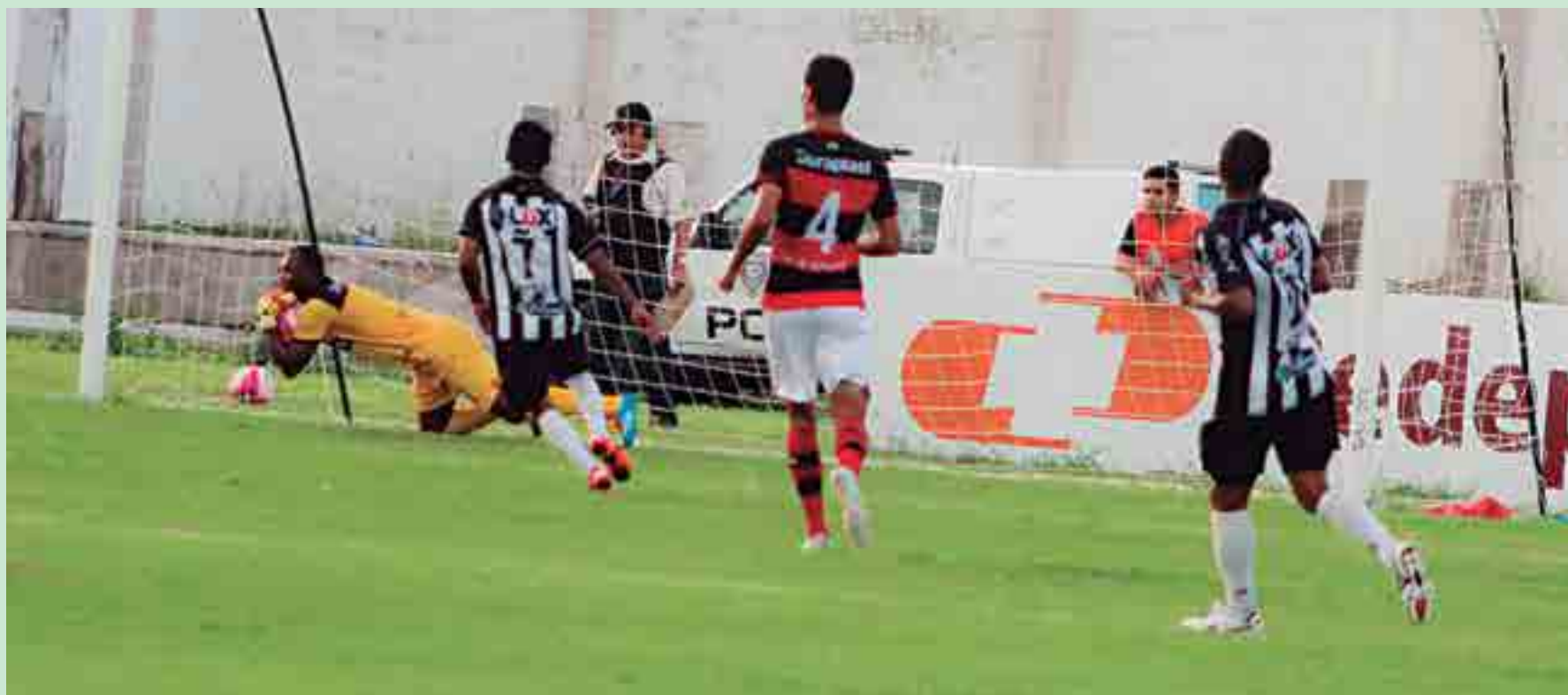
Depois de perder para o Campinense, o Treze resolveu dispensar alguns jogadores e ao mesmo tempo fazer novas contratações para a reta final do Paraibano e da Copa do Nordeste