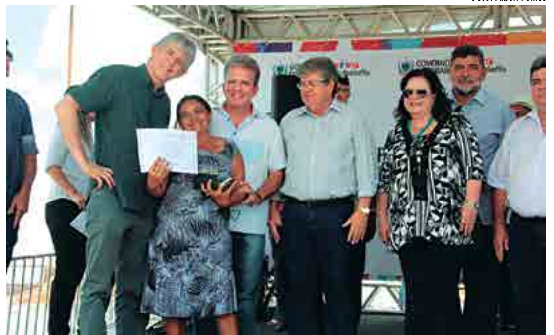
Na solenidade, foram entregues 136 certificados de cursos profissionalizantes realizados pelo Governo em parceria com o Senai

A Escola Sady e Ágaba tem 968,12 m 2 de área construída. Possui seis salas de aula, três salas para laboratórios, sala de professores, arquivo, diretoria, banheiros e outras dependências. Já a Unidade Básica de Saúde possui recepção, consultórios de atendimento, consultórios odontológicos, sala de farmácia, de enfermagem, sala de imunização, copa, entre outros ambientes.