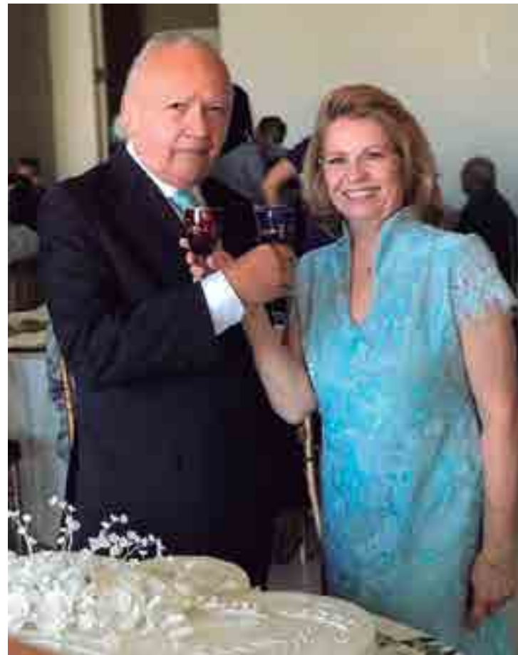
O casal brinda aos 50 anos de muito amor e companheirismo