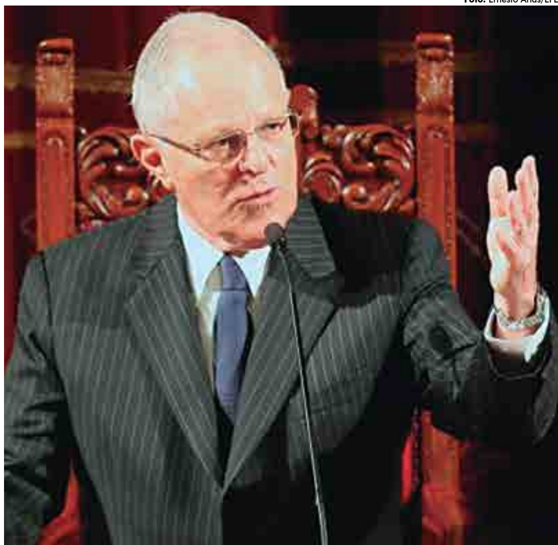
O presidente do Peru, Pedro Pablo Kuczynski, é acusado de receber propina da construtora brasileira Odebrecht