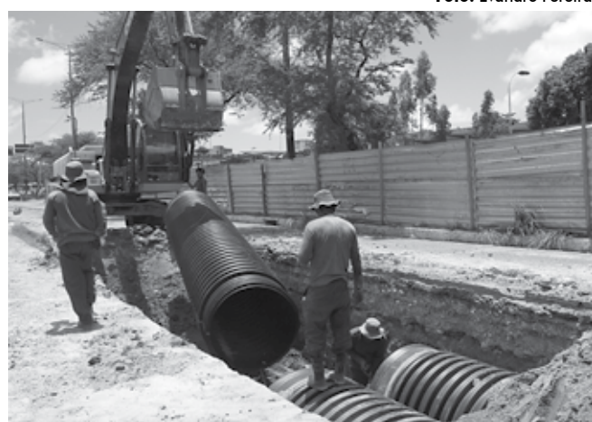
Bloqueio é mantido até amanhã para execução de obras de drenagem